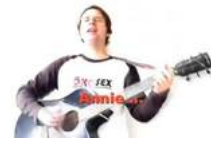
Annie Lennox said to me...

Übrigens behaupte ich, dass es im Moment "the most sexiast" Auto überhaupt ist. Es verkörpert